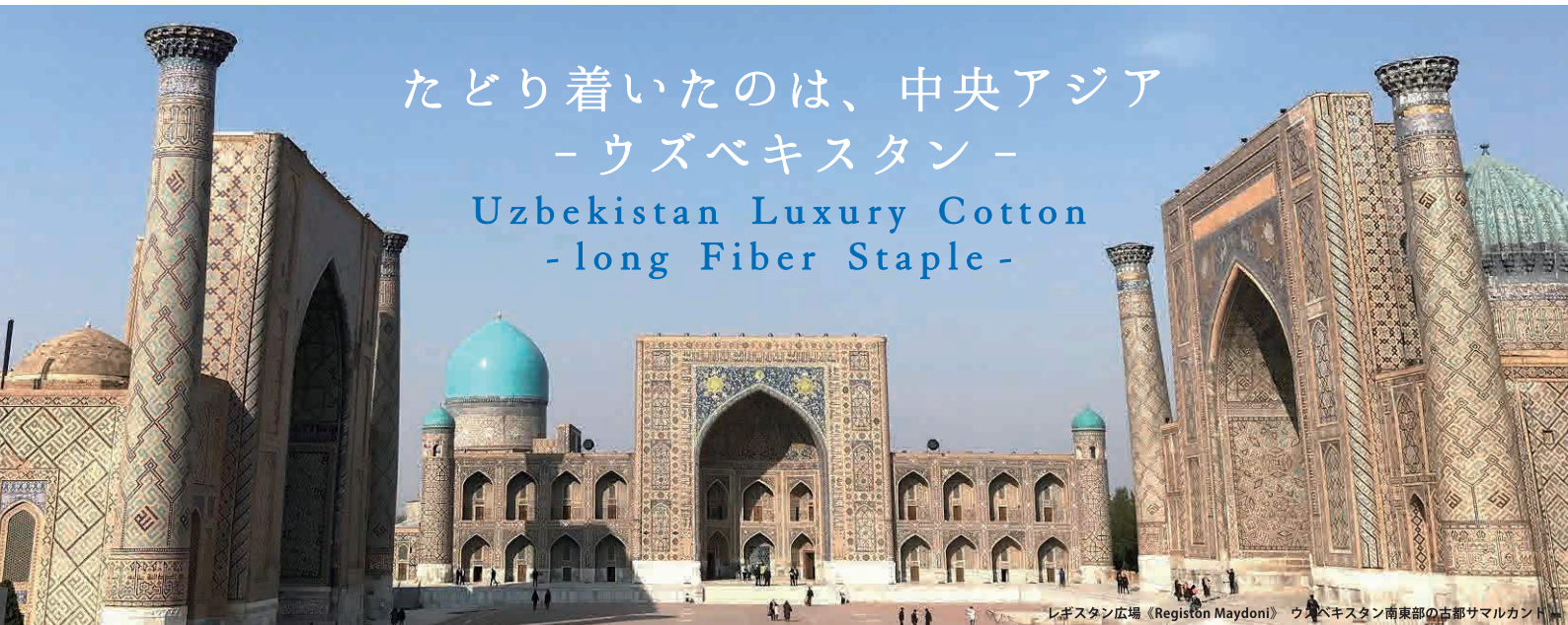
レジスタン広場 (Registon Maydoni) ウズベキスタン南東部の古都サマルカント

Uzbekistan Luxury Cotton -long Fiber Staple-